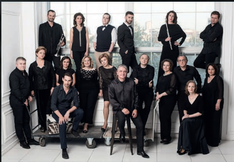
Studio for New Music ensemble